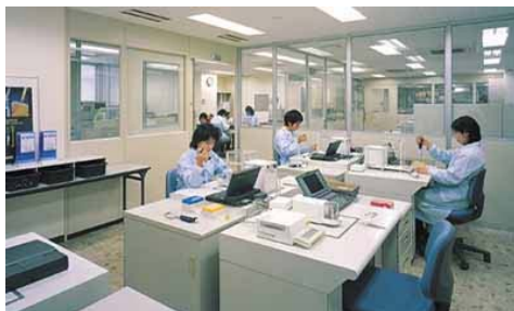
株式会社エー・アンド・デイ