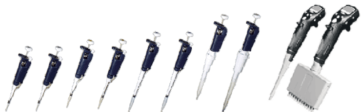
エムエス機器株式会社

〒170-0013 東京都豊島区東池袋 3-23-14 ダイハツ・ニッセイ池袋ビル 5 階 TEL. 03-5391-6126 FAX. 03-5391-6129