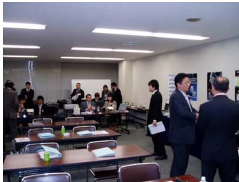
第1回セミナー風景 / デモ機での実習風景