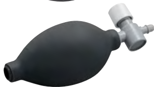
ゴム球ユニット UA-BULBASSY-JC2 標準価格¥800(税込価格¥840) JANコード 4981046712606