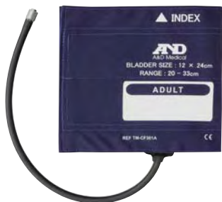
MEラテックスフリーカフ TM-CF301A 標準価格¥8,000(税込価格¥8,400) JANコード 4981046712668