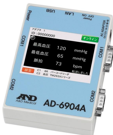
データ収集アダプタ「AD-6904A」