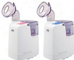
UN-135-P ピンク JAN コード 4981046311380