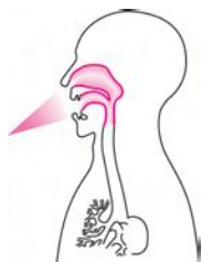
吸入粒子径による到達部位

ミストは小さい粒ほど奥まで届きます。ホットシャワー5は約5マイクロメートルというとても細かい霧を噴霧。ミストを沈着させたいのどや鼻の奥に届く最適な大ききさで、気持ちよく潤わせます。