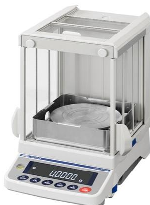
MC-Aシリーズ (ガラス風防付き)

株式会社エー・アンド・デイ（本社：東京都豊島区、代表取締役執行役員社長：森島 泰信）は、ロングセラー製品のマスコンパレータ（質量比較器）「MC シリーズ」の測定精度と安定性を向上させることにより使用感を高めたマスコンパレータ「MC-A/MC-M シリーズ」を新発売いたしました。