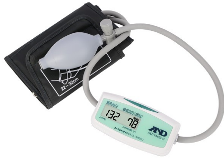
シンプルな個装箱