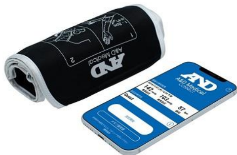
Bluetooth内蔵 上腕式ホースレス血圧計「UA-1200BLE」