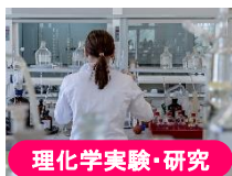
理化学実験・研究