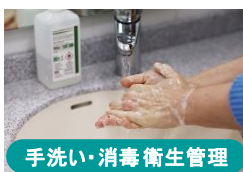
手洗い・消毒衛生管理