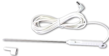
子機用 温度プローブ (1本)