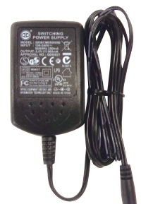
親機用 ACアダプター