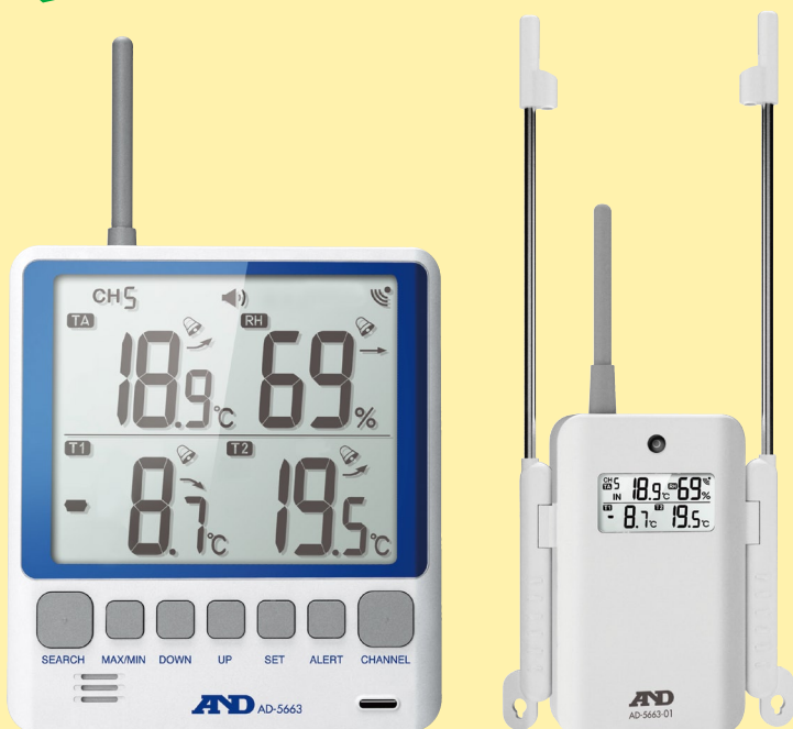
親機 (表示器・受信機)