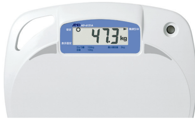
標準表示 (個人測定時)

集団健診時に便利な対面表示。 本体裏面の切替スイッチで、液晶上の表示文字の天地が逆転します。