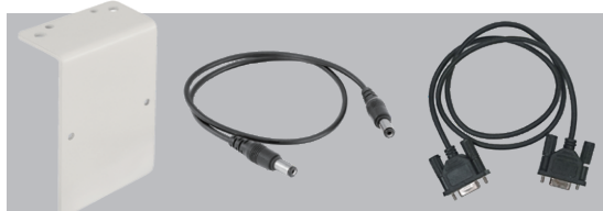
AD6083用プリンタ取付キット AD-PR580-006

また、プリンタ用紙は指定の専用紙をご使用ください。印字の品質劣化や、プリンタの故障の原因になります。