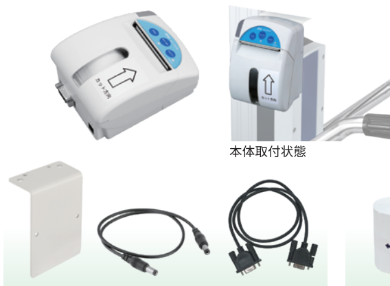
AD6082用プリンタ取付キット AD-PR580-006

測定結果の記録に便利なオプションプリンタ。 自動印字のほか、表示器のスイッチ操作により印字が可能です。 ※ご使用には、AD-PR580-006プリンタ取付キットと併せてご使用ください。 また、プリンタ用紙は指定の専用紙をご使用ください。印字の品質劣化や、プリンタの故障の原因になります。