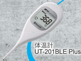
体温計 UT-201BLE Plus

イー・アンド・デイの血圧計、体温計、活動量計、体組成計のデータを1つのアプリで管理することができます