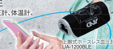
上腕式ホースレス血圧計 UA-1200BLE