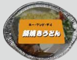
アルミ製容器 (鍋焼きうどんなど)