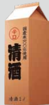
アルミ箔パック (酒・焼酎など)