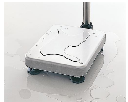
ステンレス製計量皿（SUS304）