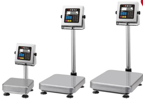
Sサイズ HW-10KCWP HV-15KCWP