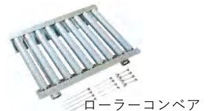
ローラーコンペア

◆1 USBインタフェース / RS-232Cインタフェースは、いずれか1chのみ装着可能