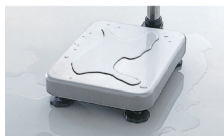
ステンレス製計量皿(SUS304)