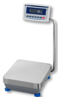
スイングアーム型 (一体型) GX-L / GF-L