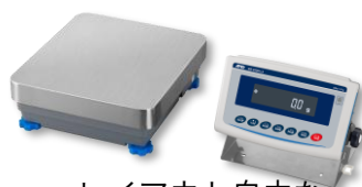
レイアウト自由な 表示部 分離型 GX-LS