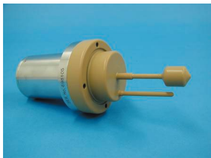
テフロンコーティング