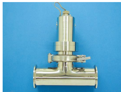
2Sサニタリーチーズ管