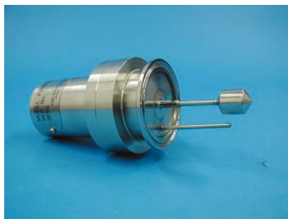
2Sフェールプローブ