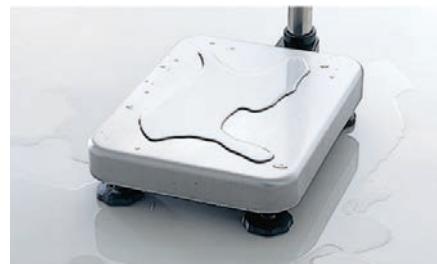
ステンレス製計量皿(SUS304)

株式会社 AND エーアンド・デー 本社: 〒170-0013 東京都豊島区東池袋3丁目23番14号