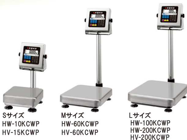
Sサイズ HW-10KCWP HV-15KCWP