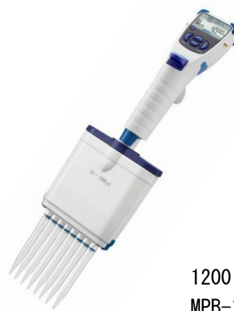
1200 \mu L MPB-1200-8