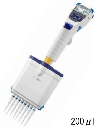
200 \mu L MPB-200-8