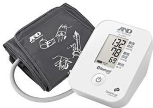
パーソナル血圧計 UA-651BLE