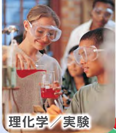
理化学 / 実験