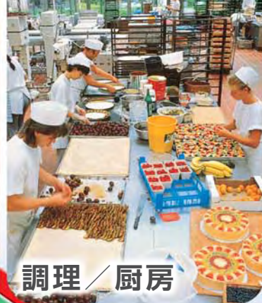
調理 / 厨房