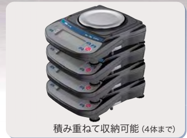
積み重ねて収納可能 (4体まで)