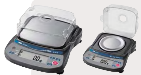
プラスチック風防 EJ-11JA (別売品)