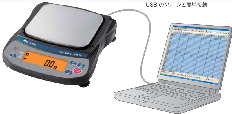
USBでパソコンと簡単接続