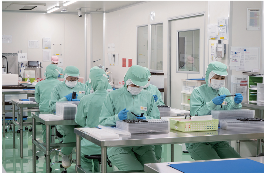
最高レベルの清浄度のクリーンルームで全数検査