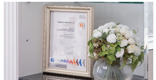
ISO22716 (化粧品GMP) 認定証

機器を梱包して送る手間もなく、輸送事故による故障のリスクもありません。また、実際に機器を使っている現場の環境に合わせた校正をしていただけるので安心です。