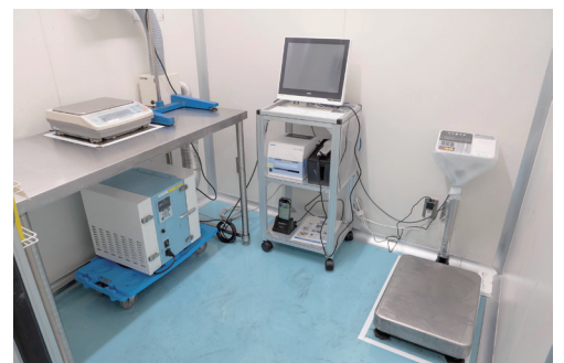
パソコンに接続されたA&D製の電子天びんと台はかり

アイライナーの処方では、従来の市場では石油系がスタンダードだった原料も植物系原料への転換が図られていまして、当社としてもその取り組みを強化しています。