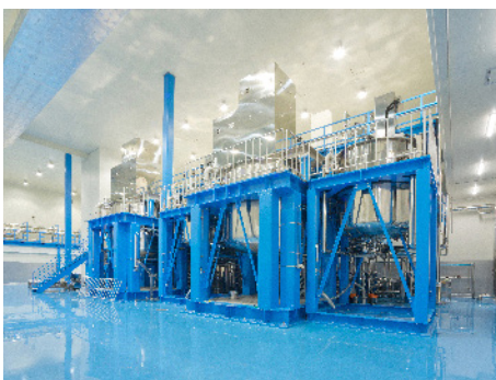
コスモ・ニスト様を飛躍させたクリーンな製造室