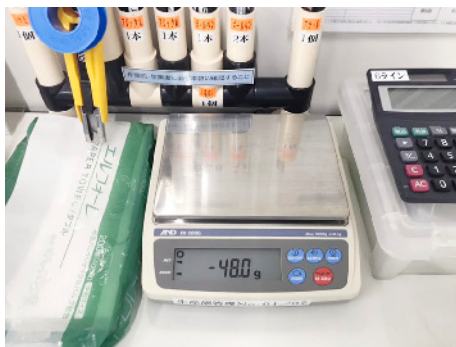
以前からずっとご使用いただいている、 A&D製コンパクト天びんEK-2000i