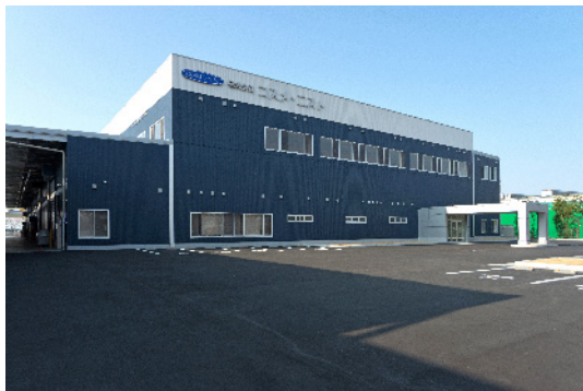
第二工場(明和工場)